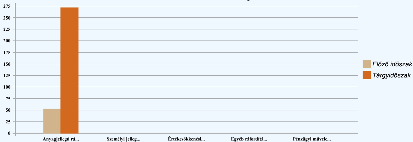
Ráfordítások alakulása és megoszlása